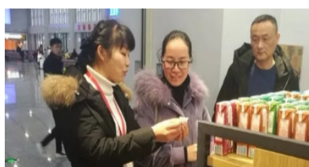
价格监督人员在高铁站内现场检查。