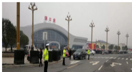
交警在洞口高铁站站前广场执勤。